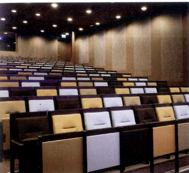
FOTO LINKS Het auditorium heeft 168 zitplaatsen.