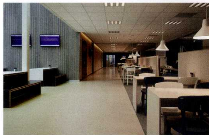
FOTO LINKS Deel van het studentenplaza op de begane grond. Het auditorium is bekleed met vlit. Links de ingang van restaurant La Place.

FOTO BOVEN Loungebar Les Saveurs, een van de plaatsen waar de studenten hun kennis in de praktijk kunnen brengen.