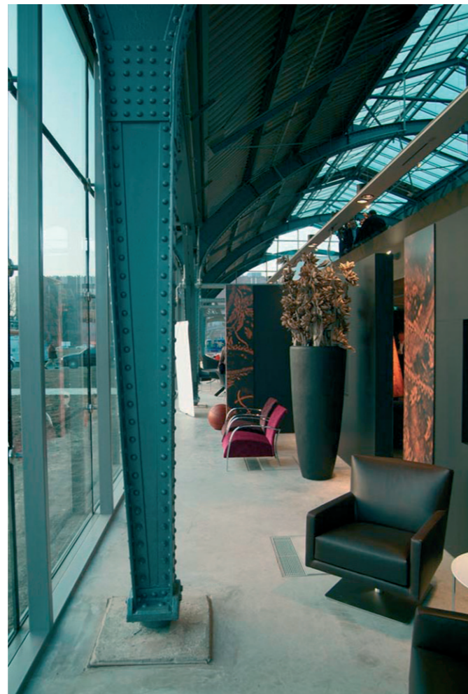
Design Post Köln, Duitsland