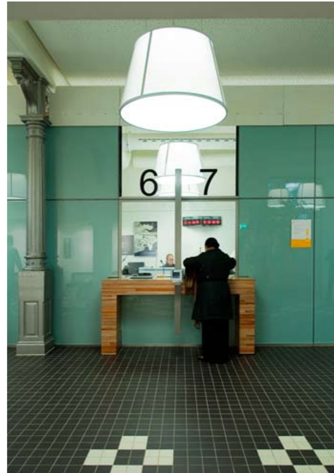
Stadsbank van Lening, Amsterdam