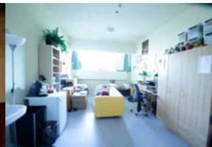
mijn eigen plek gaat mee ....