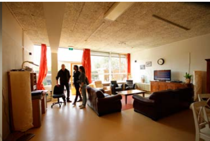
de woonkamer is ook werkplek en gezamenlijk en privé