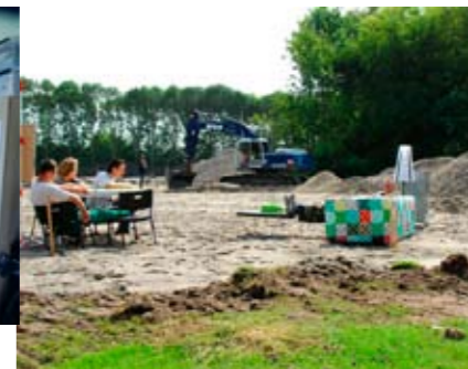
op de bouwplaats konden we ons nieuwe onderkomen al af en toe 'proeven'