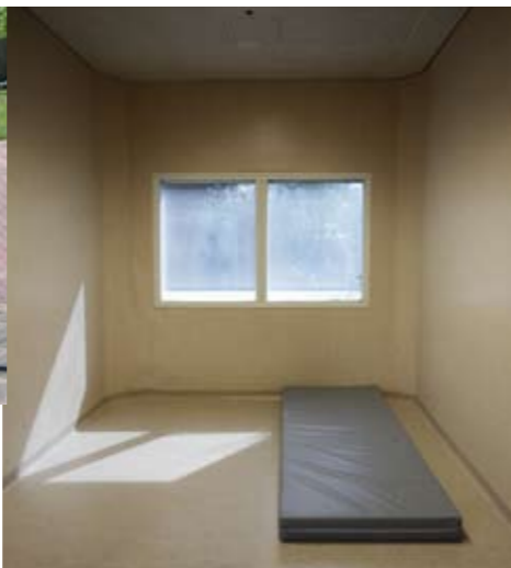
thuis....? voor bewoners een heel ander begrip