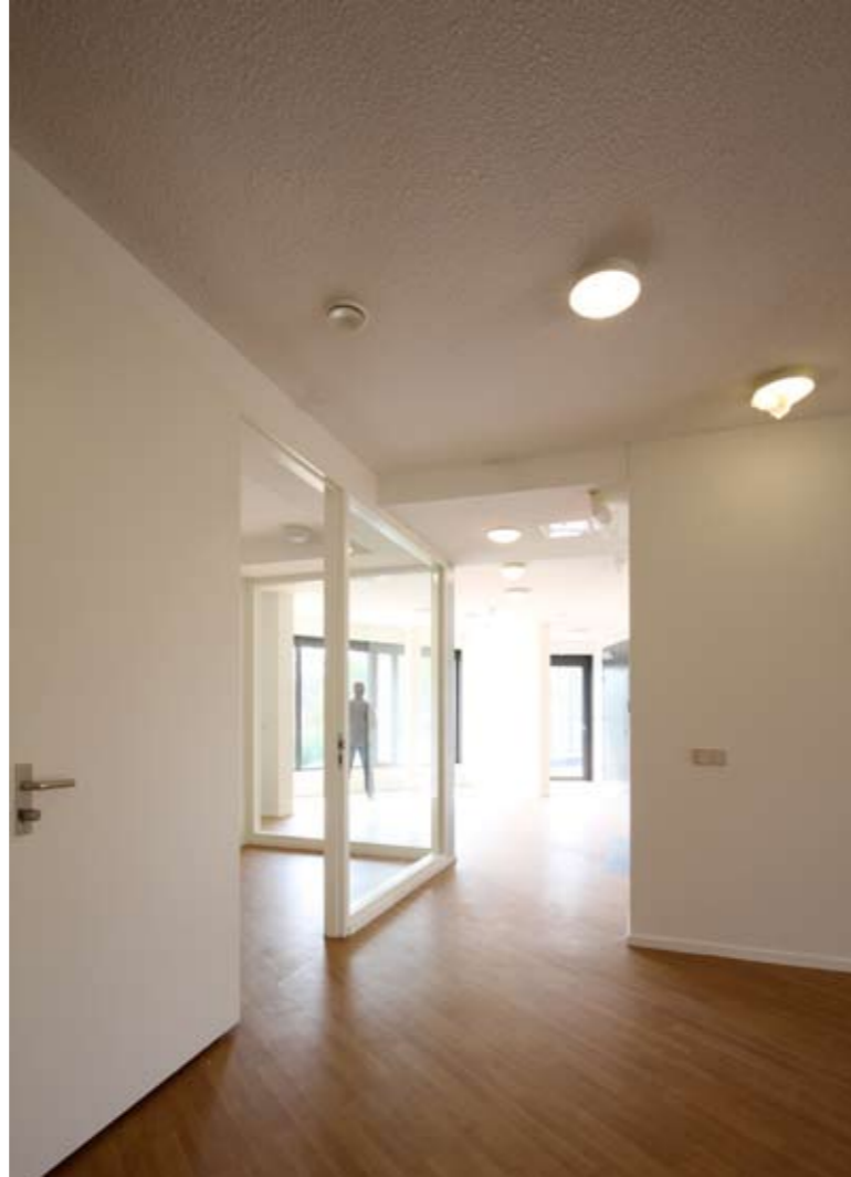
overzicht en licht in de woonkamers