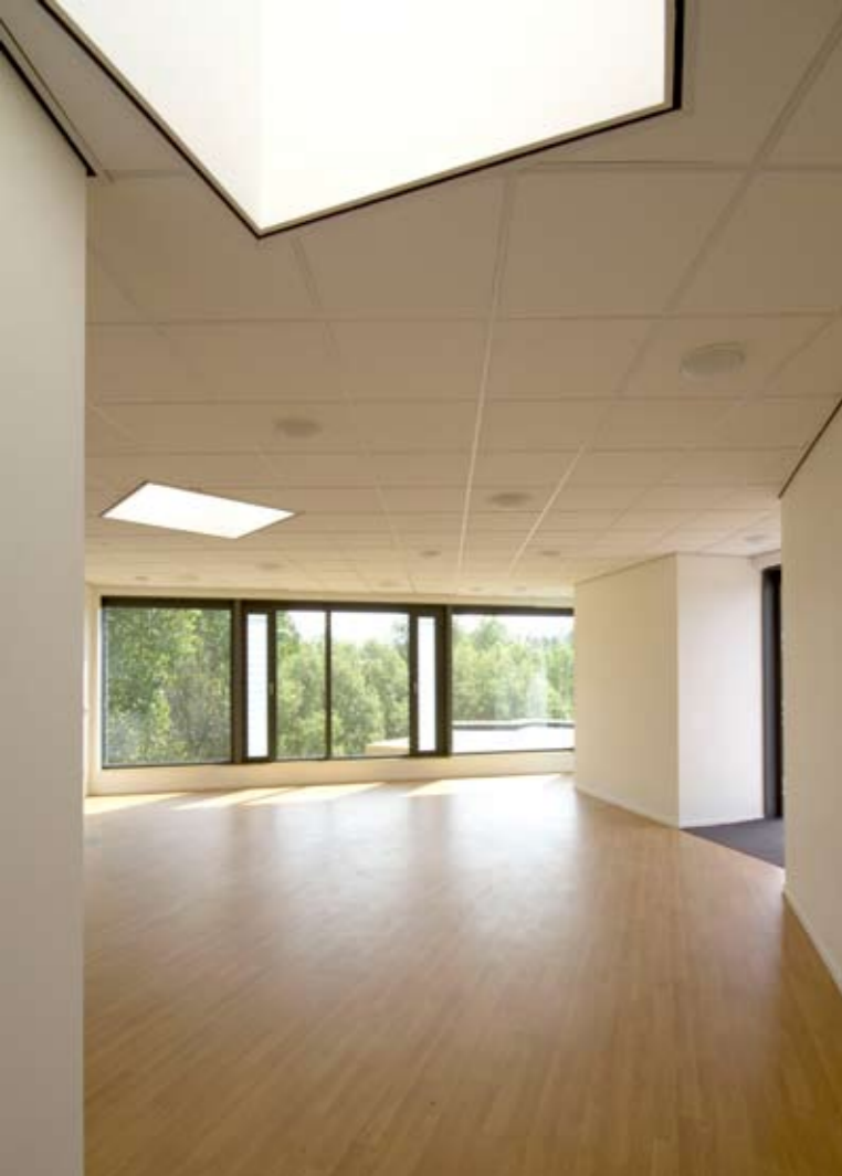
dagbesteding op de bovenste verdiepingen