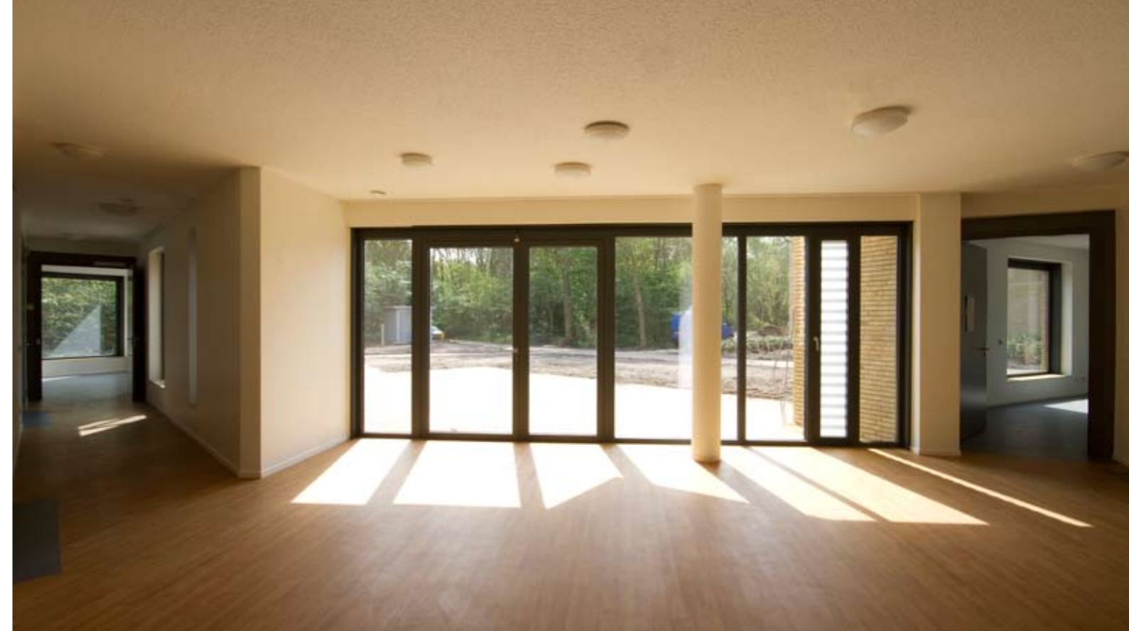
licht is leidend van ruimte naar ruimte