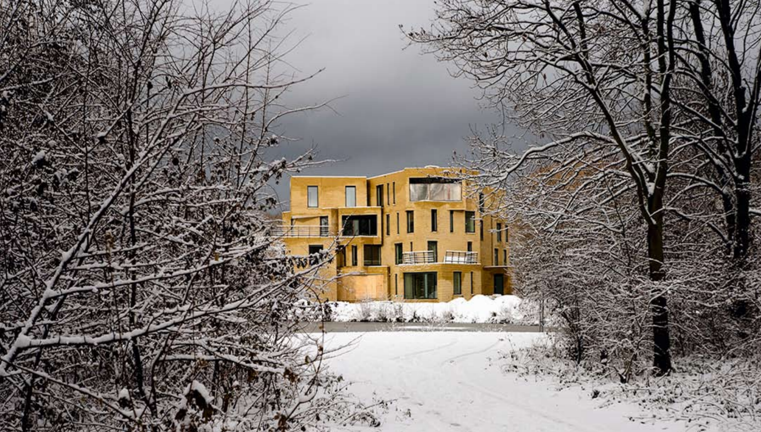
zorgvuldig tussen het bestaande groen vervlochten