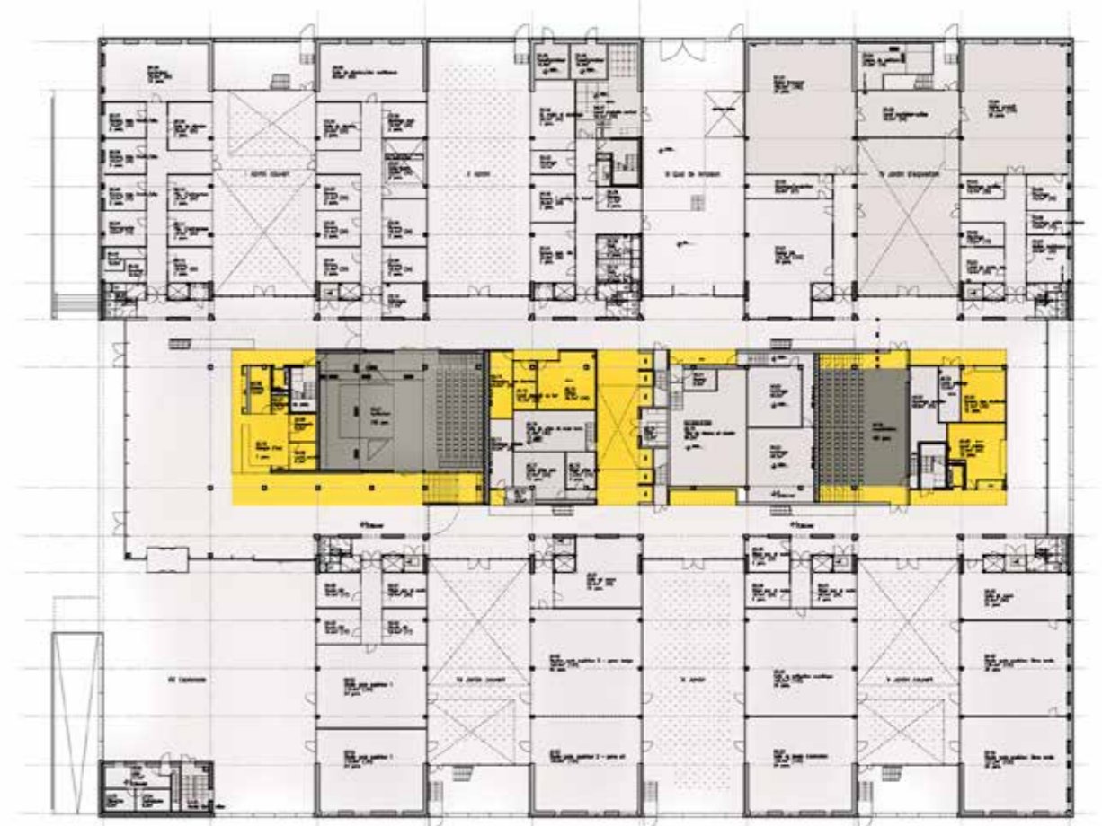
Serre Numérique, Anzin, FR