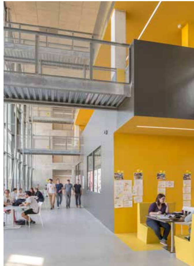
Serre Numérique, Anzin, FR