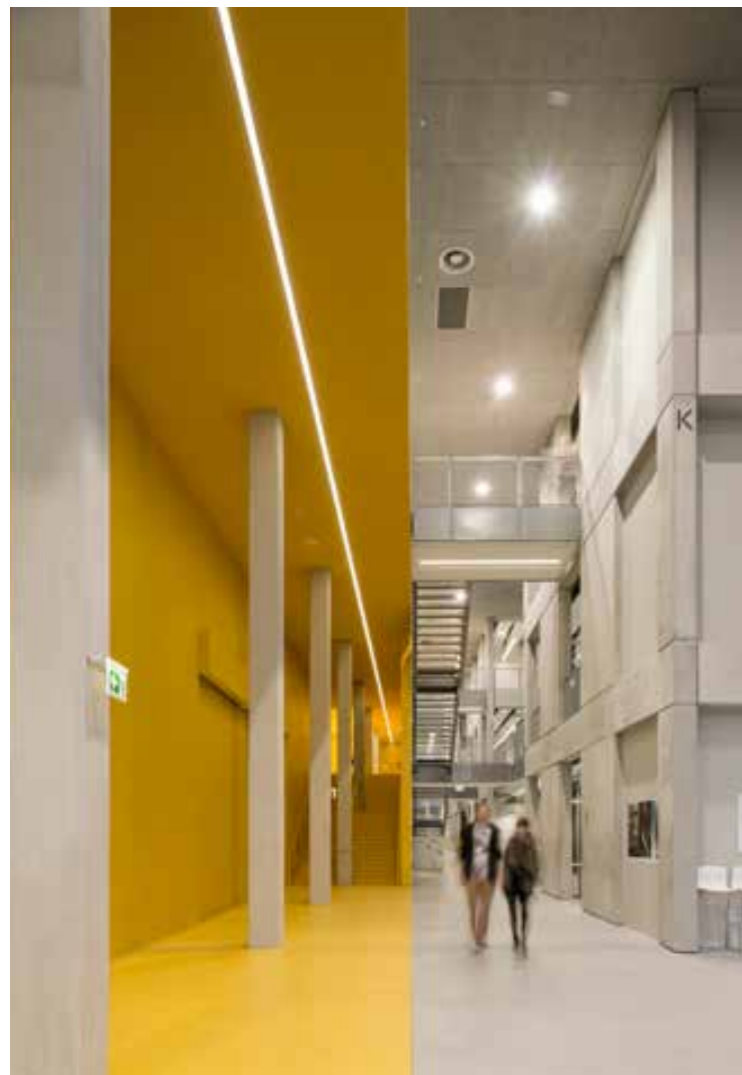
Serre Numérique, Anzin, FR